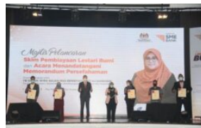
SME Bank biaya PKS