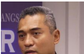
Kes pukul: Lan Pet Pet