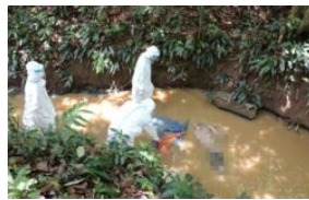
Gara-gara ajak isteri orang bersetubuh, warg...