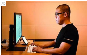
Dad Earns RM451,857 a Month with Bitcoin