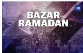
Pas bernombor had