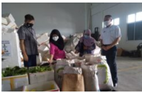
Polyform bantu jimat kos pelupusan pasar borong